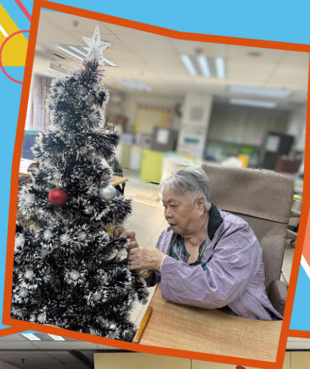
聖誕節來臨， 攜手佈置聖誕樹， 一齊來開Party。