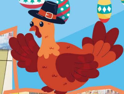
另一主角：聖誕 大火雞，同樣非 常受歡迎。