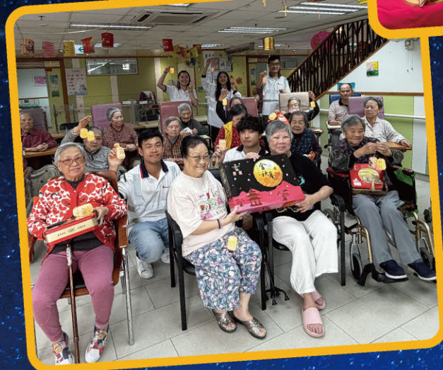
一年一度中秋節， 義工長者齊慶賀！